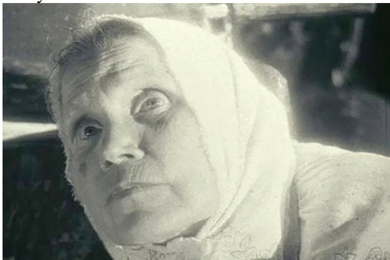
Кадр: Фильм «Бибинур»

Возвращаясь к истокам. О чем снимают татарские режиссеры и почему это заслуживает внимания